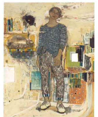
國司華子「理」(平成26年)