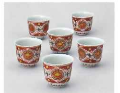
「赤玉手向付 六」(昭和13年頃)