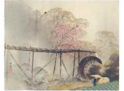
川合玉堂「春雨」(昭和17年頃)