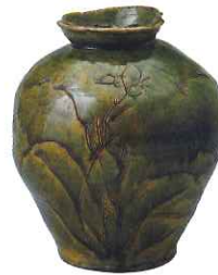
「於里遍あや免花入」(昭和27年頃)

北大路魯山人(1883～1959)の生誕140年、そして魯山人館の開館3周年を記念し、当館コレクションの中から選りすぐりの名作約120点を展示するとともに、このほど寄贈された魯山人自筆の献立表、写真などの貴重な資料もあわせて公開します。