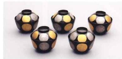
「日月橋 いつかん」(昭和18年頃)