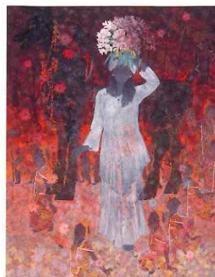
井手康人「百花為誰開」(平成25年)

当館は、公益財団法人日本美術院が主催する日本美術院展覧会(院展)に、「足立美術館賞」を設けています。本展では、歴代の足立美術館賞受賞作を一堂に展示します。