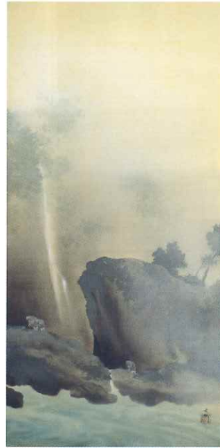
横山大観「渡船」(明治34年)