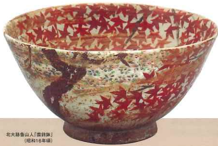
北大路魯山人「雲錦鉢」 (昭和16年頃)